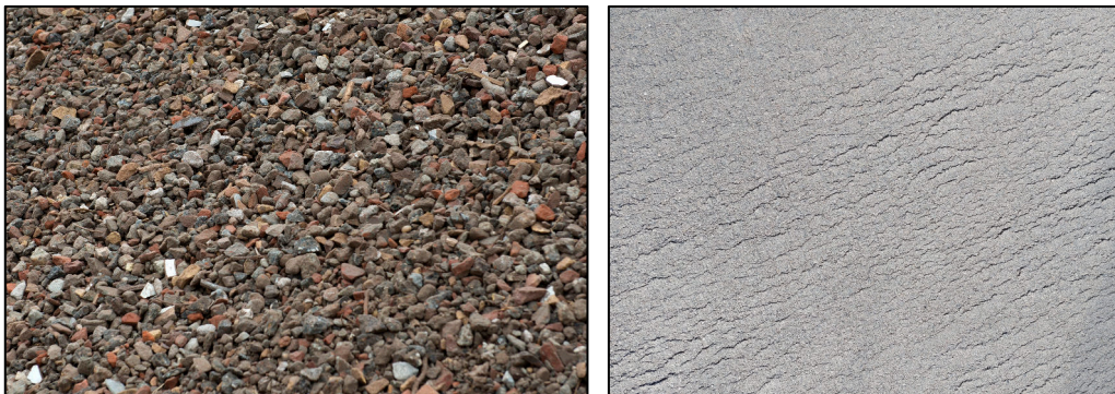
Figuur: Weergave van hydraulisch menggranulaat (links) – Revicon® padverharding (rechts)